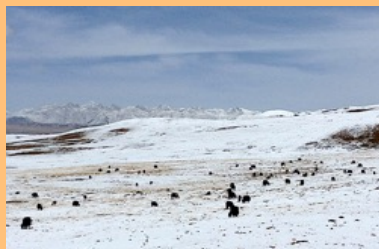
Wetter im Winter +5°C bis +10°C tags bei Sonne -20°C bis -35°C tags ohne Sonne Oft eisige Windböen.